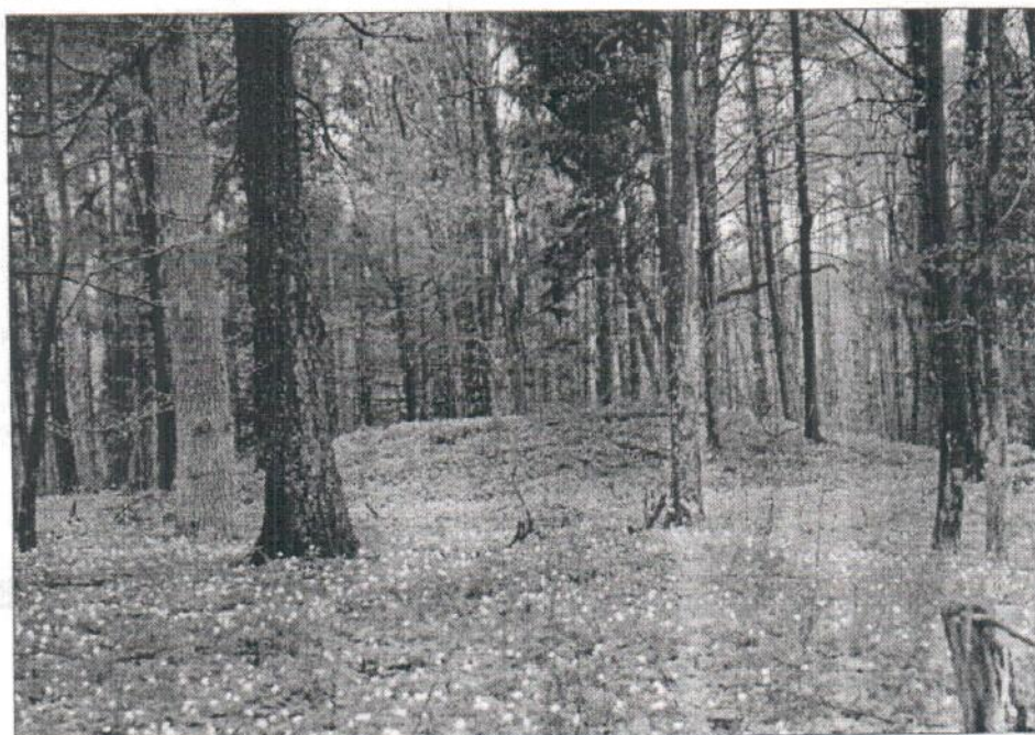
1 pav. Taip šiuo metu atrodo vienas iš Mižeikių pilkapių

Tolesnis Mižeikių, bei kitų Karaliaučiaus muziejaus rinkiniuose buvusių archeologinių radinių likimas - keblus klausimas šiandienos mokslininkams, nes didžioji jų dalis dingio II Pasaulinio karo metais. Liko tik nedaugelio jų aprašymai ir iliustracijos, skelbtos periodiniuose leidiniuose bei monografiuose, kurios keliauja iš knygos į knygą.