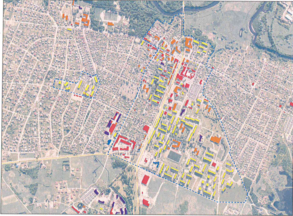
Išskirtinio žemėlapis, 2018