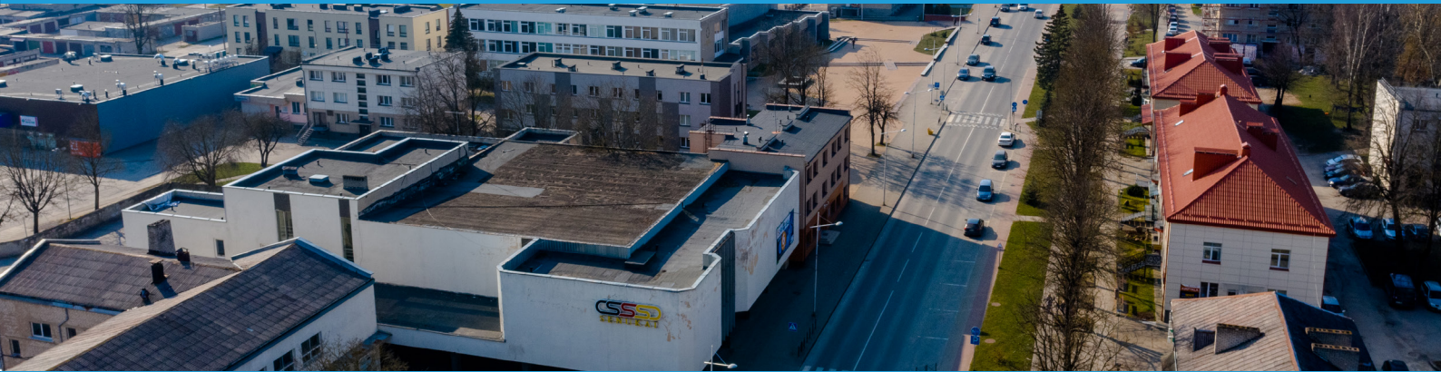
PER METUS ĮREGISTRUOTA MAŽŲ IR VIDUTINIŲ ĮMONIŲ