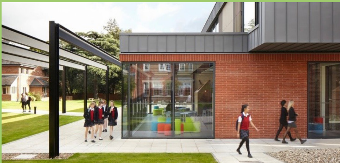
1 pav. nuotrauka iš investicinio projekto